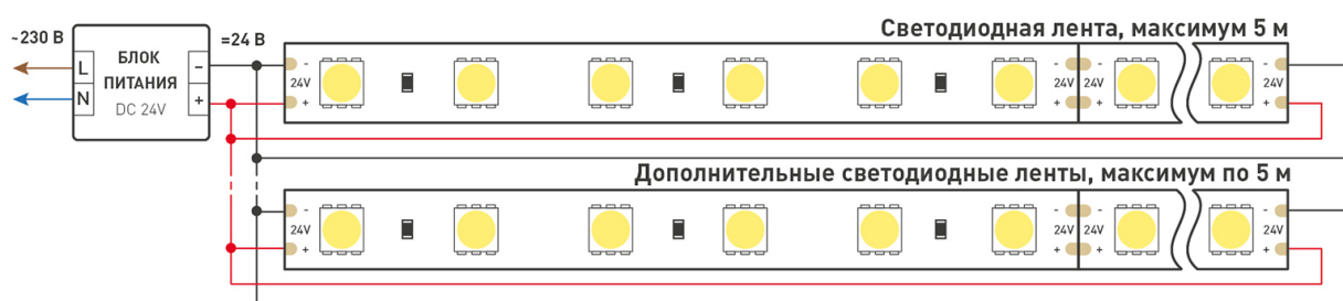
Схема 2. Подключение нескольких светодиодных лент с двух сторон.

Рекомендуется использовать для обеспечения равномерного свечения ленты по всей длине.