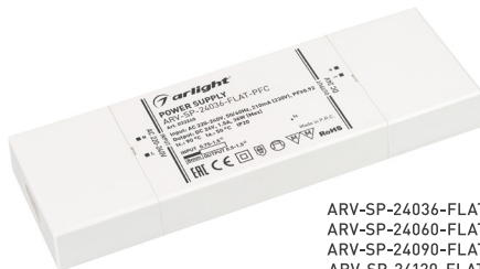
ARV-SP-24036-FLAT-PFC ARV-SP-24060-FLAT-PFC ARV-SP-24090-FLAT-PFC ARV-SP-24120-FLAT-PFC