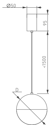
Рис. 1. Чертеж и габаритные размеры

* При соблюдении условий эксплуатации и снижении яркости не более чем на 30% от первоначальной.