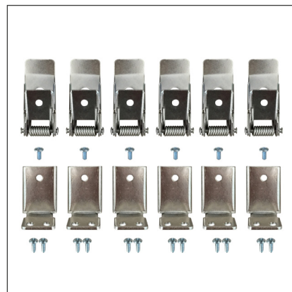
037007 Набор FX-T6 для панелей 1200