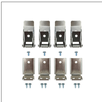
037006 Набор FX-T4 для панелей 300, 600