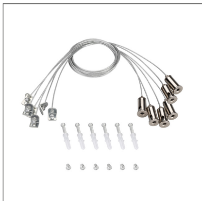
037005 Набор SPX-T6 для панелей 1200